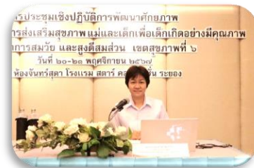
สรุปการประเมินความพึงพอใจการจัดประชุมเชิงปฏิบัติการฯ