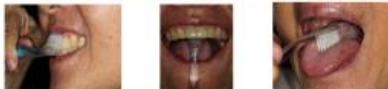
ฟันหน้าบนด้านซ้าย ฟันหน้าบนด้านขวา แปรงฟันด้วยแปรงสีฟัน