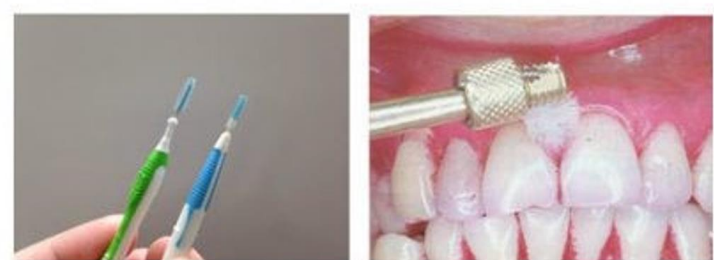
ทันตแพทย์จะแนะนำแปรงขอกฟันขนาดและรูปร่างที่เหมาะสมกับขนาดขอกฟัน