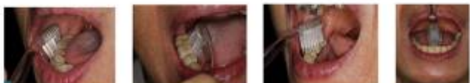
ฟันหลังล่างด้านซ้าย ฟันหลังล่างด้านขวา ฟันหลังล่างด้านบนซ้าย ฟันหน้าล่างด้านซ้าย