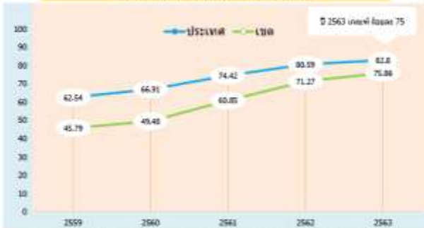
ร้อยละหญิงตั้งครรภ์ที่ได้รับการฝากครรภ์ครั้งแรกก่อนหรือเท่ากับ 12 สัปดาห์ เขตสุขภาพที่ 6 ปี 2559 - 2563