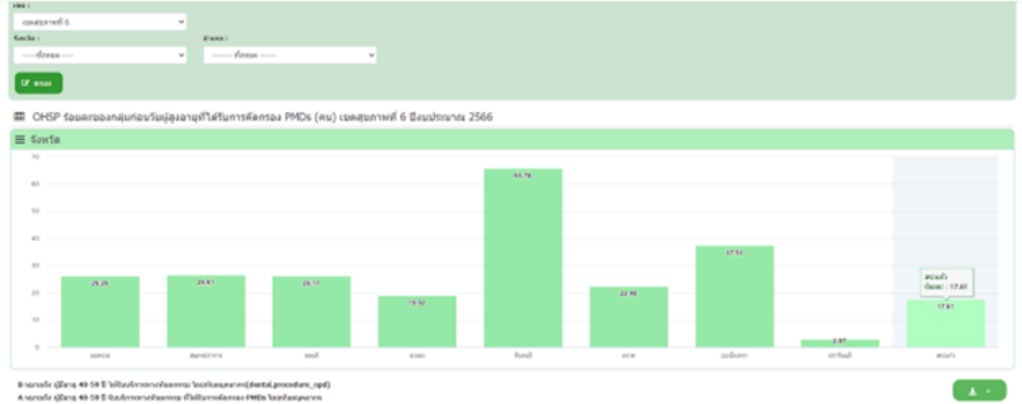
คัดกรองรอยโรคก่อนมะเร็งช่องปากในกลุ่มอายุ 40-59 ปี

กลุ่มก่อนวัยผู้สูงอายุ (40-59 ปี) มารับบริการทันตกรรม 16,416 ราย ได้รับการคัดกรองรอยโรคก่อนมะเร็งช่องปาก 10,798 ราย (ร้อยละ 65.78) พบรอยโรค 5 ราย คิดเป็นร้อยละ 0.05 จ.จันทบุรี