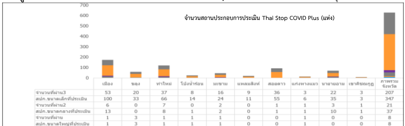
แผนภูมิที่ 1 จำนวนของสถานประกอบการที่ประเมิน Thai Stop COVID Plus รายอำเภอ เขตสุขภาพที่ 6