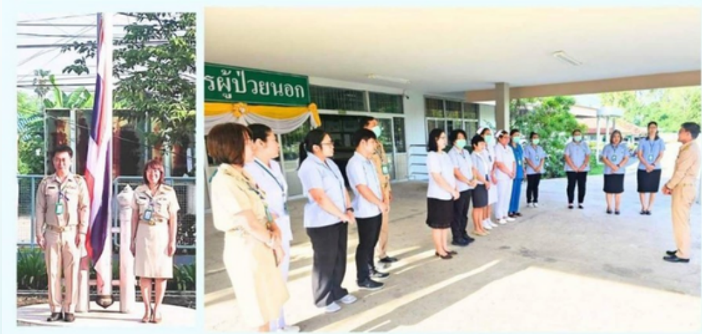
จัดทำโดยกลุ่มส่งเสริมความรู้และสื่อสารสุขภาพ

วันที่ 13 พฤศจิกายน 2566 นายแพทย์สุทัศน์ ไชยยศ ผู้อำนวยการศูนย์อนามัยที่ 6 ชลบุรี นำคณะผู้บริหารและเจ้าหน้าที่ เข้าแถวเคารพธงชาติ และสวดมนต์ไหว้พระ ณ บริเวณด้านหน้าเสาธง หน้าอาคารสำนักงาน และร่วมกิจกรรม "พบปะ ยามเช้า" ครั้งที่ 4 โดยท่านผู้อำนวยการได้แจ้งนโยบาย และมอบหมายงานและภารกิจต่างๆ รวมถึงประเด็นกิจกรรมของศูนย์อนามัยที่ 6 ที่ได้จัดกิจกรรมของสัปดาห์ที่ผ่านมา ให้คณะผู้บริหารและเจ้าหน้าที่ได้รับทราบ