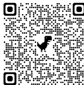
QR-code ผลการสำรวจ Anamai Event Poll

การสำรวจ Anamai General Poll ครั้งที่ 17 และ Anamai Event Poll ประเด็น “ความกังวลต่อการระบาดของโรคโควิด 19 ในช่วงเทศกาลปีใหม่” สามารถเข้าร่วมตอบแบบสำรวจได้ตั้งแต่วันที่ – 31 ธันวาคม 2564