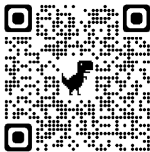
QR-code ผลการสำรวจ Anamai General Poll

ผลการสำรวจ Anamai Event Poll ความกังวลต่อการระบาดของโรคโควิด19 ในช่วงเทศกาลปีใหม่ ผู้ที่เข้ามาตอบแบบสำรวจเป็น จำนวนทั้งหมด 3,113 ราย และเขตสุขภาพที่ 6 อยู่ในลำดับที่ 8 จำนวน 49 ท่าน จังหวัดที่มีจำนวนผู้ตอบแบบสำรวจมากที่สุด คือ จ.ชลบุรี 11 ราย รองลงมา คือ จ.สมุทรปราการ 8 ราย และ จ.ปราจีนบุรีบุรี 27 ราย